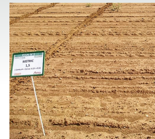
Metric 1.5 l/ha